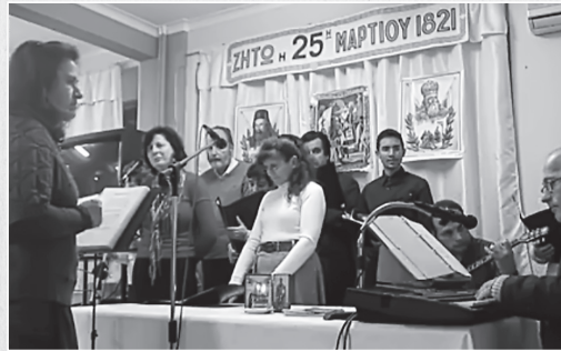
Ἀπὸ παλαιότερη ἐκδήλωση.