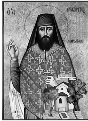
Γεώργιος Καρσλίδης (+1901-1959) Ἐορτάζεται στὶς 4 Νοεμβρίου .

Ἀπολυτίκιον. Ἦχος α'. Τῆς ἐρήμου πολίτης