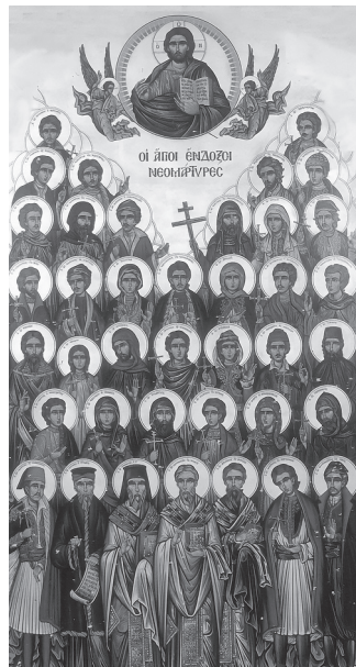
Οἱ Νεομάρτυρες γιορτάζουν, κατ' ἔθος, τὴν Γ' Κυριακὴν Ματθαίου

Γιὰ νὰ τὸ πετύχουν, βεβαίως, αὐτοί, οἱ Ἅγιοί μας, δὲν ζοῦσαν συμφῶνως πρὸς τὶς δικές των ἀρχὲς καὶ τοὺς τρόπους τοῦ κοινωνικοῦ των περιγύρου, ἀλλὰ συμφῶνως πρὸς τὴν ὀρθὴ πίστη, τὴν ἀληθινὴ ζωὴ καὶ τὴν δίκαιη πολιτεία τοῦ μόνου Βασιλέως καὶ Σωτῆρος Χριστοῦ. Πράγματι, οἱ Ἅγιοί μας δὲν ἀκολουθοῦσαν