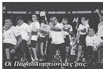
Οἱ Παραολυμπιονίκες μας.

Εἶναι πράγματι ἀποκαρδιωτικὴ ἡ κα- τάσταση τῆς σύγ- χρονης νεολαίας. Ἵποπτα κυκλώματα, παραθρησκείες, ναρ- κωτικά, μαγείες καὶ καταστρεπτικὲς ἰδε- ολογίες βάλθηκαν νὰ