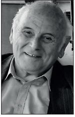
Τοῦ Κωνσταντίνου Γανωτῆ, φιλολόγου-συγγραφέως

(...) Ὁ σημερινὸς ἀστός βλέπει νὰ χάνονται καὶ νὰ διαφεύδονται τὰ ἀστικά ὄνειρά του, ὅτι δηλαδή θὰ ἔχει πλοῦτο καὶ δύναμη νὰ γίνεῖ εὐτυχημένος μὲ τὴν ἐπιστήμη καὶ τὴν πολιτική. Βλέπει τὸν θάνατο νὰ σαρώνει τὰ πάντα καὶ βρίσκεται στὴ φάση νὰ φωνάζει μαζί μὲ τὸν Σοφοκλῆ: « Ἴω γενεαὶ βροτῶν, ὡς ὑμᾶς ἴσας καὶ τὸ μὴδὲν ζώσας ἐναριθμῶ ». Γι' αὐτό, σὰν τὸν χορὸ τῶν Θηβαίων αἰσθάνεται κι αὐτὸς ὅτι μάρτην χορεύει. Κάπως ἔτσι γεννιέται ἡ κατάθλιψη στὸν κόσμο, οἱ καταχρήσεις, τὰ παρὰ φύσιν πάθη, οἱ κατακτήσεις ἄλλων χωρῶν καὶ ... ἡ εὐτυχία χάνεται.