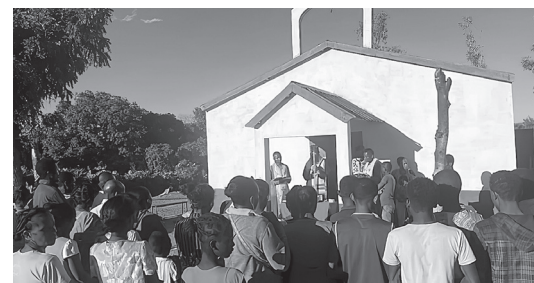
Θυρανοξία τοῦ Ἱεροῦ Ναοῦ Οσίας Εἰρήνης Χρυσοβαλάντου στο Χωριὸ Ἀμπρανύ τῆς Νοτίου Μαδαγασκάρης.

Ἱεραποστολὴ Ἐπισκοπῆς Τολιάρας καὶ Νοτίου Μαδαγασκάρης