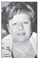
Ἐπιμέλεια: Μακρίνα Ῥάγκα, Δικηγόρος, Γενικὴ Γραμματέας τῶν Ἐπάλξεων

« Κ ἂν θάνατος ἦ, κἂν πειρασμὸς ἢ ἕτερόν τι τῶν κακῶν, εὐχὴ καὶ νηστεία διαλύεται » (Ἱερὸς Χρυσόστομος). Τόσο μεγάλη εἶναι ἡ δύναμη τῆς νηστείας, ὥστε ὅτι καὶ ἐὰν συμβῆ, εἴτε θάνατος, εἴτε πειρασμὸς εἴτε ὅποιο ἄλλο κακό, αὐτὰ νὰ διαλύονται μέ τὴν «εὐχή», τὴν προσευχή, καὶ μέ τὴν νηστεία. Καὶ στὸ ἴδιο τὸ Εὐαγγέλιο ἐπισημαίνεται ὅτι «τοῦτο τὸ γένος (τῶν δαιμόνων) οὐκ ἐκπορεύεται εἰ μὴ ἐν προσευχῇ καὶ νηστεία.» (Ματθ., ιζ' 21)