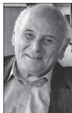
τοῦ μακαριστοῦ Κων/νου Γανωτῆ, φιλολόγου-συγγραφέως

Ὁ σημερινὸς νέος ἀνατρέφεται μέσα σὲ μιὰ οἰκογένεια ποὺ δὲν τὴ δένει οὔτε ὁ φόβος τοῦ Θεοῦ οὔτε ἡ ἄδολη ἀγάπη τῶν μελῶν της. Αὐτὴ ἡ οἰκογενειακὴ ἀγάπη σὲ λίγες οἰκογένειες πιά ἀπαντᾶται. Οἱ κοπέλες φροντίζουν τὸν ἑαυτό τους, γιὰ νὰ ζήσουν σὰν ὀρφανές, χωρὶς νὰ ὑπολογίζουν τὴ στήριξη ἐνδὸς ἀντρα δίπλα τους. Τὰ περισσότερα ἀγόρια, μεγα-