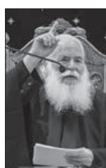
τοῦ μακαριστοῦ π. Γεωργίου Μεταλλиноῦ

Ἡ ἑλληνικὴ γλῶσσα, ὡς γλῶσσα τῆς Ἁγίας Γραφῆς καὶ τοῦ μεγαλύτερου καὶ περισσότερο πρωτότυπου μέρους τῆς πατερικῆς παραδόσεως, γίνεται ἡ γλῶσσα τῆς Ὁρθοδόξου Ἐκκλησίας καὶ ἐντάσσεται στὸ θεῖο σχέδιο τῆς σωτηρίας. Κατὰ τὴν εὐρύτητα γνωστῆ ἔρμηνείας, τὸ «πλήρωμα τοῦ χρόνου», ὡς ὁ «και-