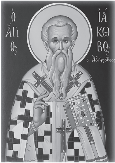
«πᾶσα δόσις ἀγαθῆ καὶ πᾶν δόρημα τέλειον ἄνωθεν ἐστὶ καταβαῖνον ἀπὸ τοῦ πατρὸς τῶν φώτων» (1άκ., α' 17).