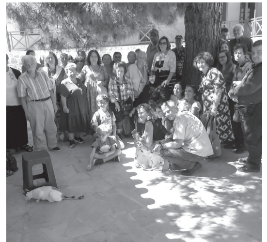
Στὸν Ἅγιο Χαράλαμπος Αὐλωναρίου

ἐπὶ δεκαεπτὰ ἔτη ὁ Ὅσιος Πορφύριος ὁ Κασοκαλυβίτης ὡς πνευματικὸς τῆς μονῆς. Ἀφοῦ προσκυνήσαμε, μᾶς προσφέρθηκαν κεράσματα καὶ ἀκούσαμε τὴν ἱστορία τοῦ μοναστηριοῦ, τὰ θαῦματα τοῦ Ἁγίου Χαράλαμπος, τὰ θαυμαστά γεγονότα ἀπὸ τὴν παραμονὴ τοῦ Ὁσίου Πορφυρίου ἐκεῖ, καθὼς καὶ διδακτικὲς ἱστορίες ἀπὸ τὴν σεβαστὴ γερόντισσα μοναχὴ Θεολογία, τὴν ὁποία εὐχαριστήσαμε ἀπὸ καρδιάς γιὰ τὴν ὑποδοχὴ καὶ τὴν ἀβραμαϊὰ φιλοξενία. Στὴν συνέχεια, ἀφοῦ γευματίσαμε κοινοβιακά, ἀναχωρήσαμε μὲ τὴν εὐχὴ τῆς γερόντισσας καὶ ἐνδυναμωμένοι ἀπὸ τὴν εὐλογία τοῦ προσκυνήματος. Κατηφορίζοντας πρὸς τὸ Αὐλωνάρι ἀπολαύσαμε τὴν ἐντυπωσιακὴ θέα πρὸς τὸν κάμφο του, ἀπὸ τὸ Αἰγαῖο πρὸς τὸ νότιο Εὐβοϊκὸ, τὴς εὐφορες κοιλάδες ἀπὸ τὴν Κύμη μέχρι τὸ Ἀλιβέρι καὶ τὴς βουνοκορφές τῆς Δίρφους.