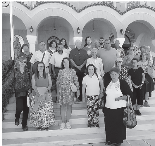
Στὸν Ἱ. Ν. Εὐαγγελισμοῦ Θεοτόκου Κανήθου

Στὴν συνέχεια, μέσῳ Χαλκίδας, περνώντας ἀπὸ τὸ Ἀρχαιολογικὸ Μουσεῖο Ἀρέθουσας καὶ διαμέσου Ἐρέτριας καὶ Ἀλιβερίου, φτάσαμε στὸ πανέμορφο ἱστορικὸ μοναστήρι τοῦ Ἁγίου Χαράλαμπος Λευκῶν στὸ Αὐλωνάρι. Εἶναι κτισμένο τὸν 10ο αἰῶνα σὲ τοπιὸ ἐξαιρετικῆς φυσικῆς ὀμορφίας ἀνάμεσα σὲ πανύψηλες λεῦκες καὶ πλατάνια καὶ ἔχει ἀνακρηχθῆ ἀρχαιολογικὸ μνημεῖο. Μετανομάστηκε ἀπὸ Εἰσοδίων τῆς Θεοτόκου σὲ Μονὴ τοῦ Ἁγίου Χαράλαμπος, ὅταν ὁ στρατηγὸς Νικόλαος Κριεζιώτης τὸ 1835, μετὰ ἀπὸ βαρὴ ἀσθένεια κατὰ τὴν ὁποία θεραπεύθηκε διαμένοντας μεγάλο χρονικὸ διάστημα στὴ μονή (ὅπου ἔμαθε τὰ πρῶτα του γράμματα καὶ ἀγαποῦσε πολὺ), χάρισε τὴν εἰκόνα τοῦ Ἁγίου Χαράλαμπος καὶ τμῆμα τοῦ Ξύλου ποὺ μαρτύρησε ὁ Ἅγιος. Στὸ μοναστήρι αὐτὸ διακόνησε