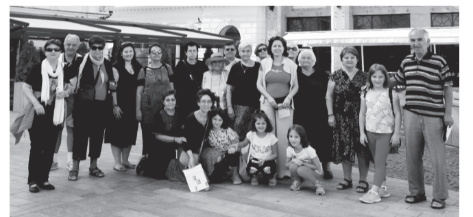
Οἱ ἐκδρομεῖς στὴν κεντρικὴ πλατεία τῆς Μπρατισλάβα, μπροστὰ ἀπὸ τὴν Ἑλληνικὴ Πρεσβεία.

Στὴν Βουδαπέστη περιηγήθηκαν στὰ ἀξιοθέατα τῆς πόλεως καὶ ἰδιαίτερα στὴν πλατεία τῶν ἀγαλμάτων, μεταξὺ τῶν ὁποίων καὶ τὸ ἀγαλμα τοῦ Οὐνιάδη, τὸ δὲ βράδυ πραγματοποιοῦσαν περὶ ἡμέρας μὲ ποταμόπλοιο στὸν Δούναβη. Στὴν Κρακοβία τῆς Πολωνίας ἐπισκέφθηκαν ἐκτὸς ἄλλων τὸ φορικτὸ στρατόπεδο τοῦ Ἄουσβιτς καὶ τὰ ἀλατωρυχεῖα. Κατευθυνόμενοι γιὰ τὴν Βαρσοβία ἐπισκέφθηκαν τὸ προσκύνημα τῆς Μαύρης Παναγίας, ὅπου φυλάσσεται βυζαντινὴ εἰκόνα τῆς Παναγίας καὶ ὅπου οἱ προσκυνητὲς σχηματίζουν λαοθάλασσες. Στὴν Βαρσοβία, ἐκτὸς ἀπὸ τὰ ἀξιοθέατα, μετέβησαν ἀνατολικώτερα καὶ προ-