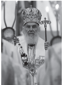
Ὁ μακαριστὸς Πατριάρχῃς Σερβίας Εἰρηναῖος

Νὰ σημειωθῇ ὅτι «ἡ Σερβικὴ Ορθόδοξη Ἐκκλησία, ἀνήκει στὶς Αυτοκέφαλες Ορθόδοξες Ἐκκλησίες. Ἐκφράζει τὴν πλειοψηφία τοῦ πληθυσμοῦ τῆς Σερβίας, τοῦ Μαυροβουνίου καὶ τῆς Σερβικῆς Δημοκρατίας τῆς Βοσνίας Ερζεγοβίνης, ἔχει ἐπαρχίες στὴ Σερβία, στὴ Βοσνία Ερζεγοβίνη, στὸ Μαυροβούνιο, στὴν Κροατία καὶ Σλοβενία, ἀλλὰ καὶ σε ὅλο τὸν κόσμο, ὅπου ζεῖ ἡ πολυπληθὴς Διάσπορά τῆς. Ἀπὸ τὸ 1219 ἡ Σερβία ἀποκτὰ τὸν πρῶτο ἀρχιεπίσκοπο Σερβίας καὶ Ζίτσας, Ἅγιο Σάββα, ἀπόφους φέρουν ὅτι ἡ μητέρα τοῦ Αναστασία εἶχε ἐλληνικὴ καταγωγή. Τὸ 1346 ἀναβαθμίστηκε σε Πατριαρχεῖο Πεκίου, τὸ ὁποῖο παρά τὶς προσπάθειες τοῦ ἐλληνικῆς καταγωγῆς Πατριάρχῃ Πεκίου Καλλινίκου, καταργήθηκε ἀπὸ τοὺς Οθωμανοὺς τὸ 1766. ...Ἐπανιδρύθηκε σε Πατριαρχεῖο τὸ 1920, μετὰ ἀπὸ ἐνοποίηση τῆς Μητροπόλεως Καρλοβιχίου, τῆς Μητροπόλεως τοῦ Βελιγραδίου καὶ τῆς Μητροπόλεως τοῦ Μαυροβουνίου.»